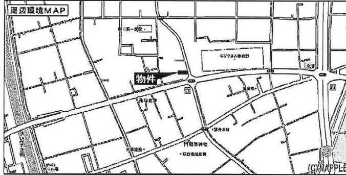
※住宅地図 P68 右側