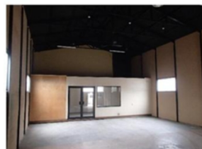
※写真は2022年6月頃に撮影したもの